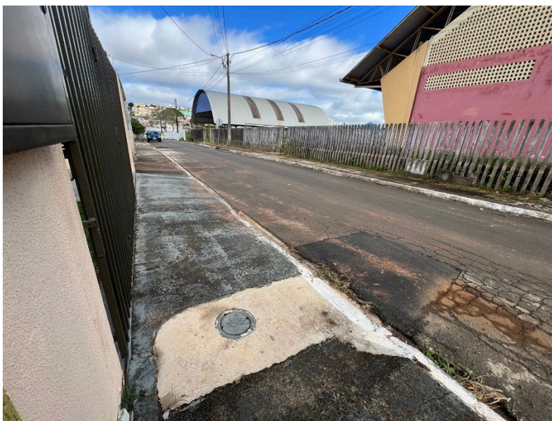
Imagem 02: Ponto da rede de esgoto existente e rede de energia existente.