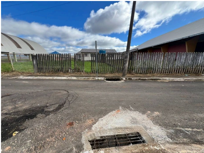
Imagem 01: Galeria de água pluvial existente.

Na imagem a seguir podemos observar a rede existente.